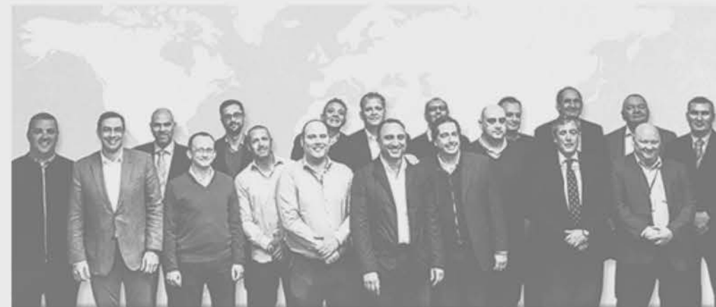
Les membres fondateurs de Global Securalliance représentent un CA cumulé de 760 M€ avec 7 600 clients dans le monde.

Ensure Security (Afrique du Sud), créé en 1970.